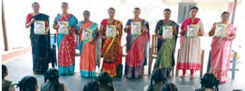
పెండ్లిమర్రి, ఆగస్టు 23, ప్రభాతవార్త: