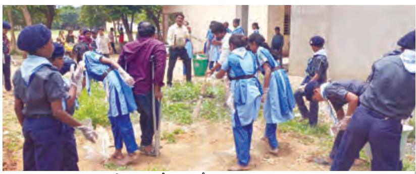
ప్రాంగణంలో శుభ్రం చేస్తున్న ఎస్సీ ని విద్యార్థులు.