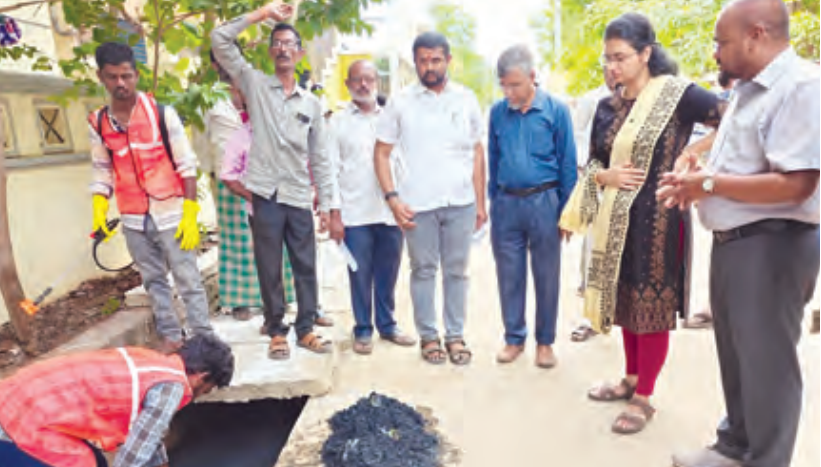
డ్రైనేజీలో పూడికతీత పనులు పరిశీలిస్తున్న సబ్ కలెక్టర్,

రాజంపేట, ఆగస్టు 23 ప్రభాతవార్త : స్వచ్ఛ ఆంధ్ర-స్వర్ణాంధ్రలో ప్రతి ఒక్కరూ భాగస్వాములై రాష్ట్ర ప్రభుత్వ లక్ష్యాన్ని నెరవేర్చేందుకు పరిసరాలు పరిశుభ్రంగా ఉంచేందుకు ఆరోగ్యంగా ఉండేందుకు పాటుపడాలని రాజంపేట సబ్ కలెక్టర్ భావన పిలుపునిచ్చారు. శనివారం మున్సిపల్ కార్యాలయంలో స్వచ్ఛ ఆంధ్ర స్వర్ణాంధ్ర ర్యాలీని జెండా ఊపి ఆమె ప్రారంభించారు. అంతకుముందు మున్సిపల్ కార్యాలయంలో సిబ్బందితో స్వచ్ఛ ఆంధ్ర స్వ