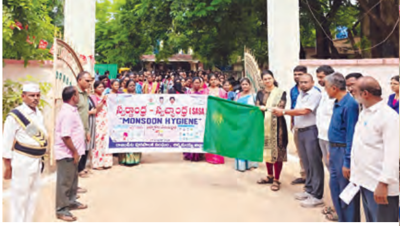
ర్యాలీ ప్రారంభిస్తున్న సబ్ కలెక్టర్ భావన