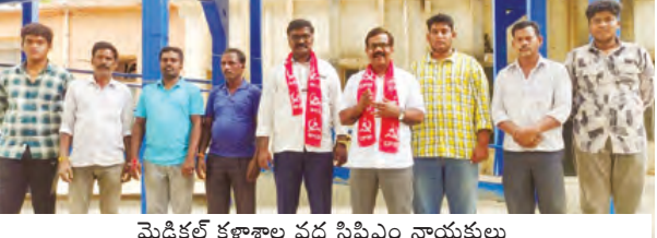
మెడికల్ కళాశాల వద్ద సీపీఎం నాయకులు