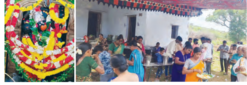
పులివెందుల, ఆగస్టు 23, ప్రభాతవార్త:

చివరి వారం జన సందోహంగా తరలి వచ్చిన భక్తులు